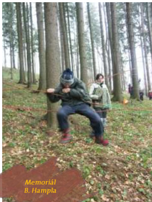
Memoriál B. Hampla