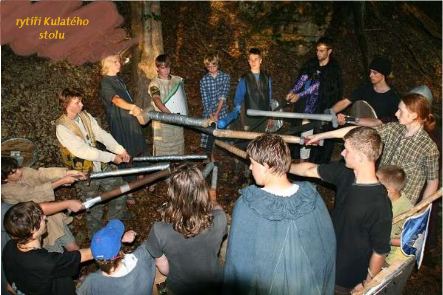
rytíři Kulatého stolu

Doufám, že se mnou budou všichni souhlasit, když napíší, že se opravdu povedl tábor. Táboru se účastnilo 14 skautů, 3 roveři a 5 dospělých. Tábořili jsme na našem tábořišti u Tatenic a s námi tam pobývala ještě vlčata. Tábor měl název „VMÍRU“ (30.6-15.7.2007), protože jsme to slýchali několikrát denně. Námět na táborovou hru byl Rytíři kulatého stolu. Každý z nás musel vlastnit meč se štítem a nějaký rytířský oblek. Tábor měl spousty zajímavých úseků, z nichž každý měl své osobité kouzlo. Poslední akce uplynulého roku byla Vánoční výprava (27-28.12.2007) na srub do Tatenic, které se zúčastnilo osm skatů. A tato akce se velmi povedla nejen proto, že se na ní projevilo Liháčovo porozumění masu, ale i proto, že tam byla správná vánoční pohoda. Celý rok byl velmi náročný pro vedení, ve kterém byli Krtek, později Liháč, z rádců Šéf, Snoopy, Mim, Rubik - těmto jmenovaným patří veliký dík za to, že s námi mají trpělivost, i když jim často lezeme na nervy. Tak ještě jednou díky všem, co se nějak podíleli na chodu oddílu. Takhle bych zhodnotil roční práci 1. oddílu střediska Zubr.