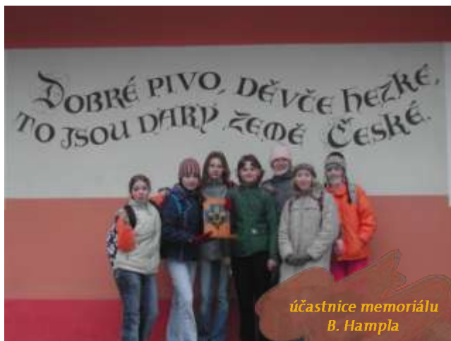
účastnice memoriálu B. Hampla