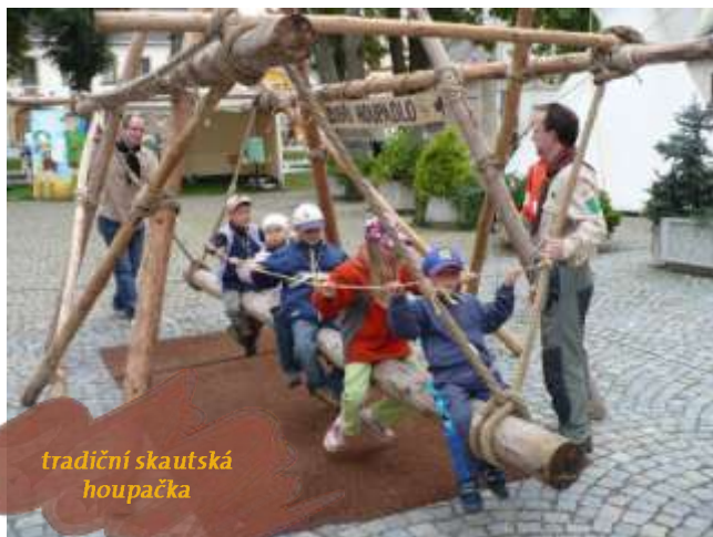
tradiční skautská houpačka

Vzhledem k tomu, že jsme tuto akci uspořádali při příležitosti turistického pochodu, nemohli jsme turistiku pominout a vyhlásili jsme pochod „X km ke 100 letům“ po Jiráskově náměstí, do kterého se mohl kdokoli zapojit tím, že ušel alespoň jeden vytyčený okruh po náměstí (250 m). Před samotnou akcí jsme doufali, že bychom mohli dosáhnout hranice 100 km, už jen proto, že by se ty dvě stovky vedle sebe pěkně vyjímaly, optimismem jsme ale radši nehýřili. Teď už víme, že za to „X“ můžeme doplnit číslovku 110 , což předčilo naše očekávání. Do pochodu se zapojily snad všechny generace - nejmladšímu účastníkovi pochodu (o kterém víme) zbývaly do porodu ještě dva měsíce, naopak nejstaršímu táhlo na 63 let – celkem 217 lidí. Abyste se vyrovnali nejunilovnější účastníci (Z. Uhlířová), „stačilo“ by obejít náměstí 63x (dohromady 15 750 m).