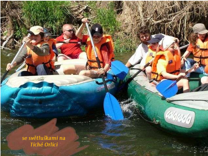
se světluškami na Tiché Orlici