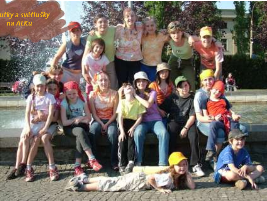
skautky a světlušky na ALKu