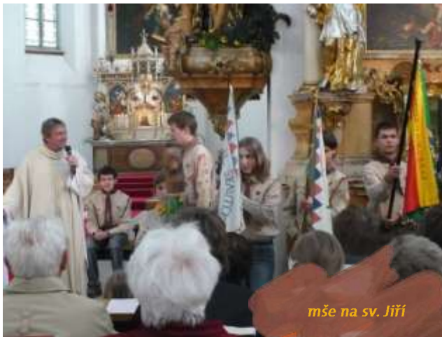
mše na sv. Jiří

V červenci jsme vyrazili na střediskový tábor, který se uskutečnil na tábořišti Vápenky u Dolní Dobrouče. Na konci prázdnin jsme se společně s rodiči rozloučili s létem, při této akci jsme si zahráli různé hry, soutěže, ale také jsme si připomněli táborové chvíle promítnutím fotografií a videa.