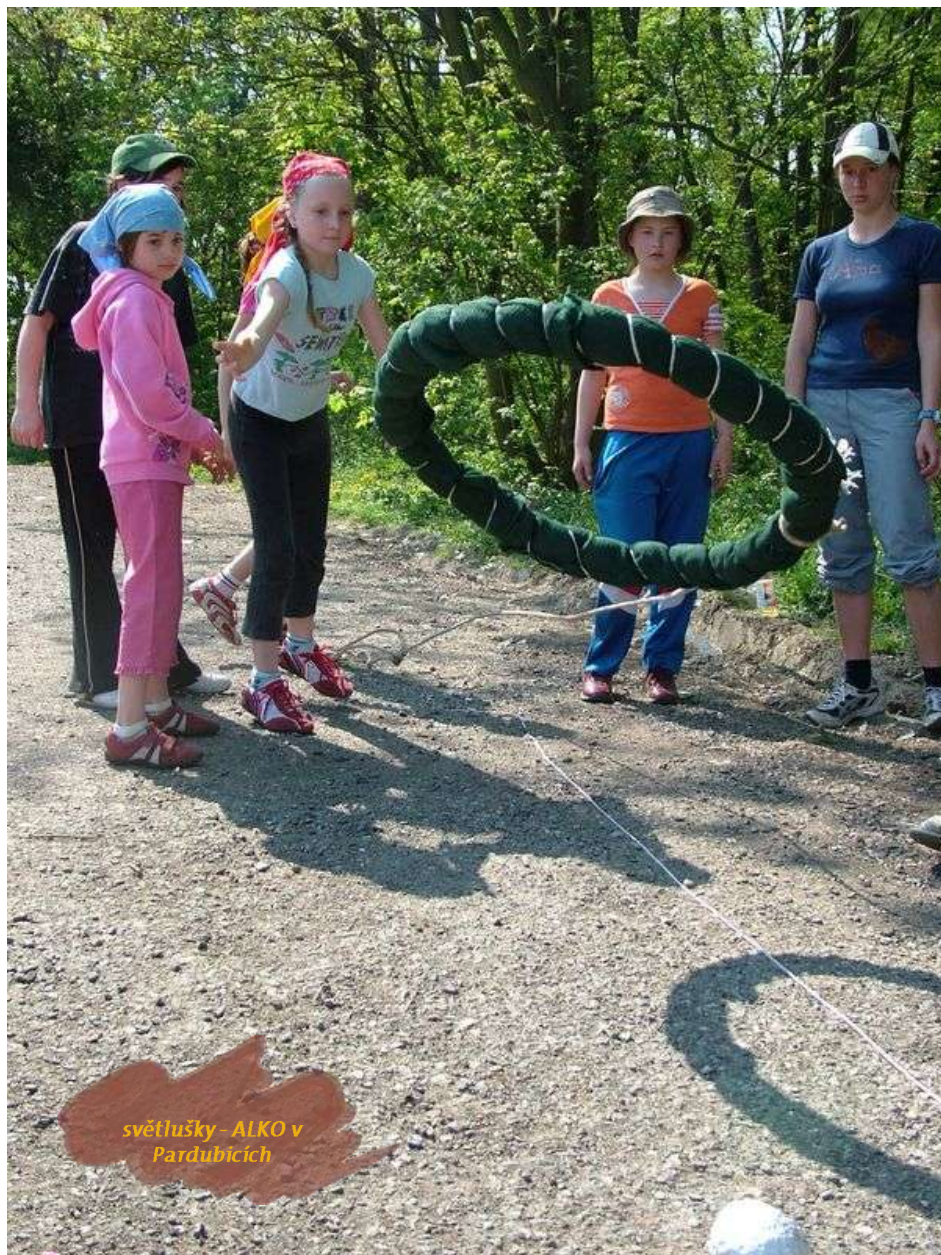
světlušky - ALKO v Pardubicích