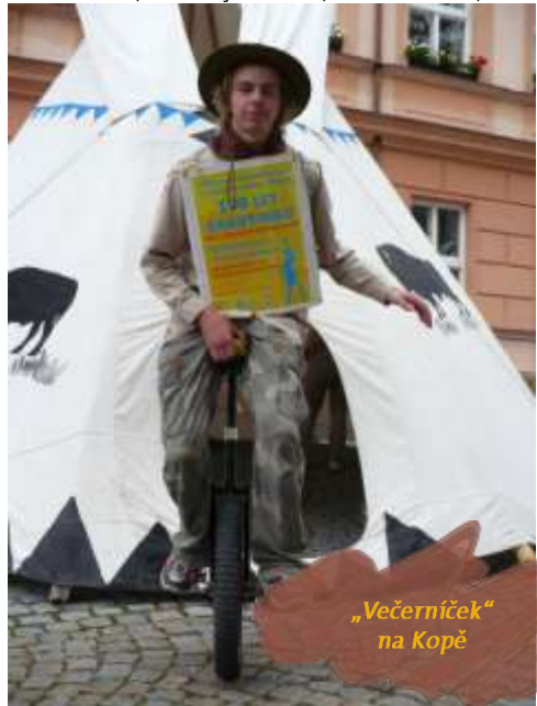
„Večerníček“ na Kopě