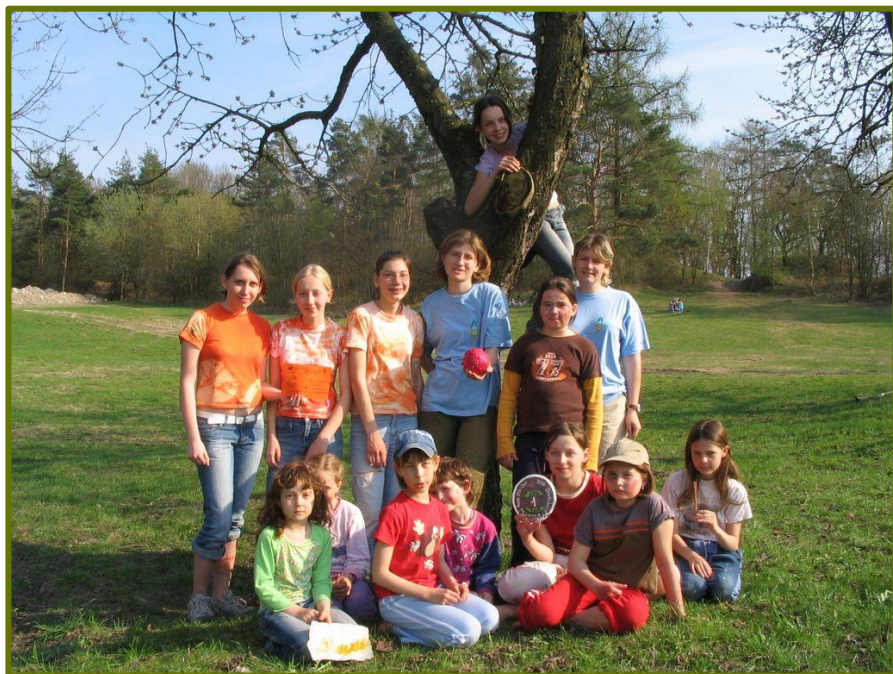
Skautky na celostátní ekologické soutěži ALKO