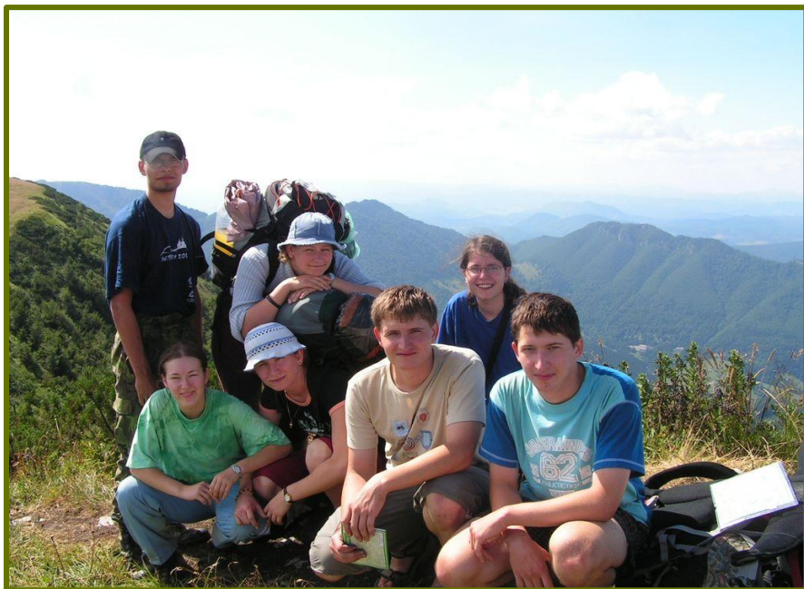
Roverské putování - Malá Fatra

Putování R&R DLONN po Malé Fatře, 31. 7. – 5. 8. 2006 – vyvrcholením celoroční činnosti roverů a rangers je vždy putovní tábor po zajímavých končinách. Letos jsme nakonec vyrazili k našim slovenským sousedům na Malou Fatru – a dobře jsme udělali. Bylo tam skutečně nádherně: stoupání k Malému Rozsutci plné vodopádů a peřejí, vznešené tajemství ranní mlhy, výhledy plné zalesněných hřebenů s ostrůvky lidských obydlí a horských luk, večere při velkolepých západech slunce, ale i únavu při vytrvalém stoupání, to vše a mnohem více jsme zažili.