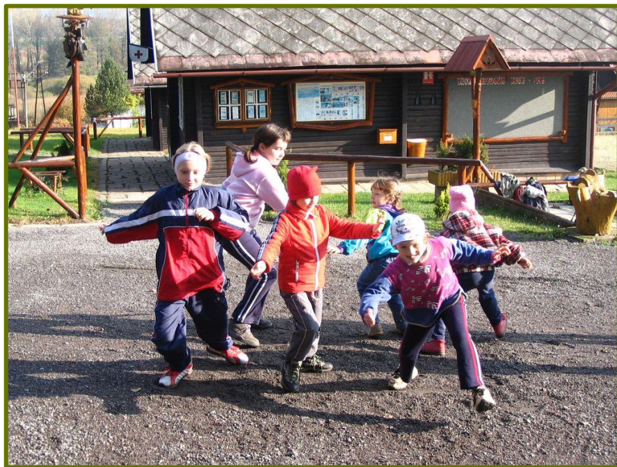
Výprava světlušek za Sýkorkou

vyřádily skautky na rybníce na Vodáckém minikurzu pro skauty a skautky. Z tábora , který se uskutečnil od 15. do 29. července na vypůjčeném tábořišti ve Vřesovicích u Kyjova, zmiňme alespoň úspěšnou CTH Holubinky, Osvětimanskou přehradu (kterou jsme využívaly téměř denně), krásné prostředí, i když poněkud „přetáborované“, plcha Pepy, zákaz rozdělávání ohně, kvůli němuž jsme musely odložit slib. Ten se uskutečnil 22. 10. na Lískovci a byl spojen s dvoudenní výpravou .