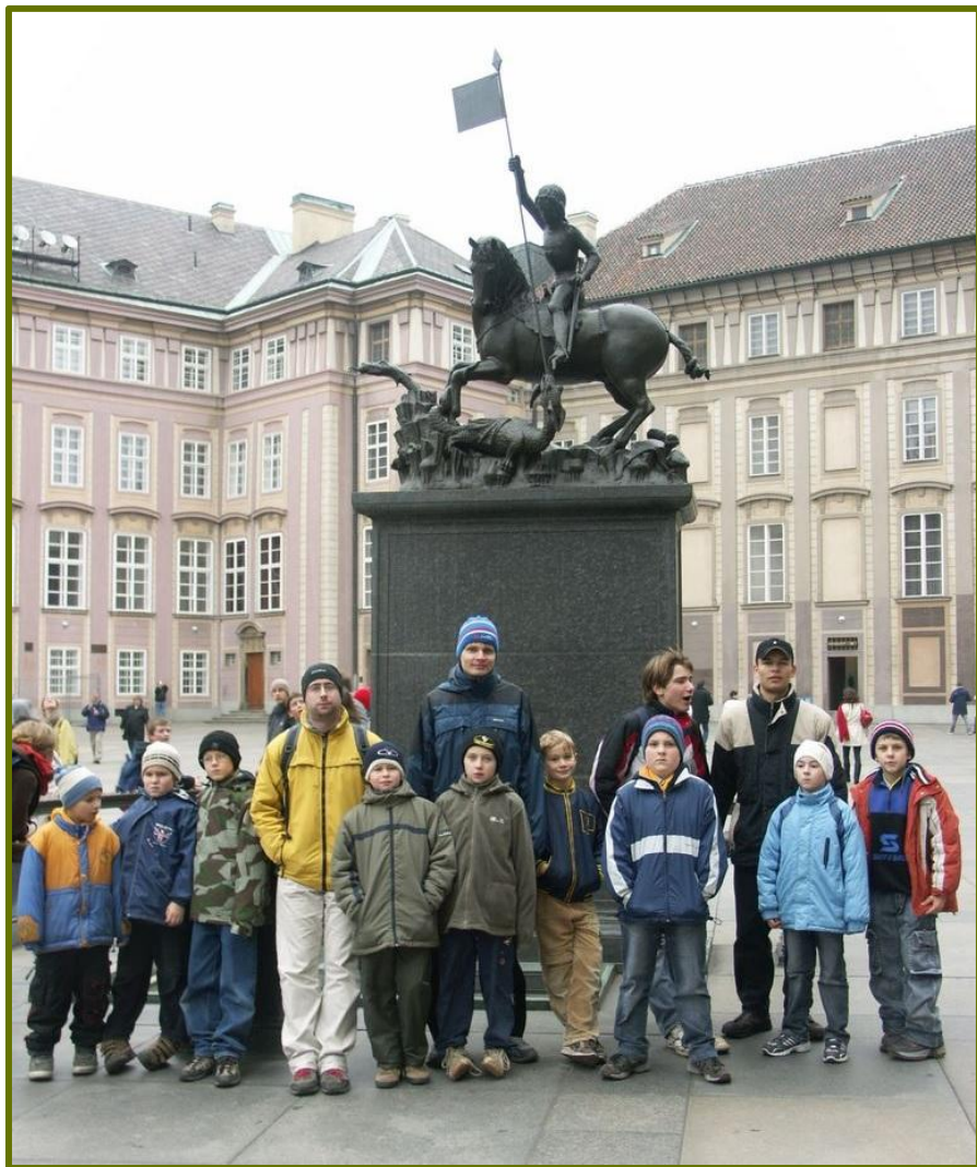
Výprava do Prahy

br. Šedáka. V sobotu ráno jsme vyrazili poznávat krásy stověžaté Prahy - navštívili jsme Petřín, Strahov, Pražský hrad, Katedrálu sv. Víta, Malou Stranu a Karlův most. V sobotu večer jsme zhlédli filmové představení Asterix a Vikingové v Cinema City. V neděli nás již čekalo pouze balení a odjezd domů.