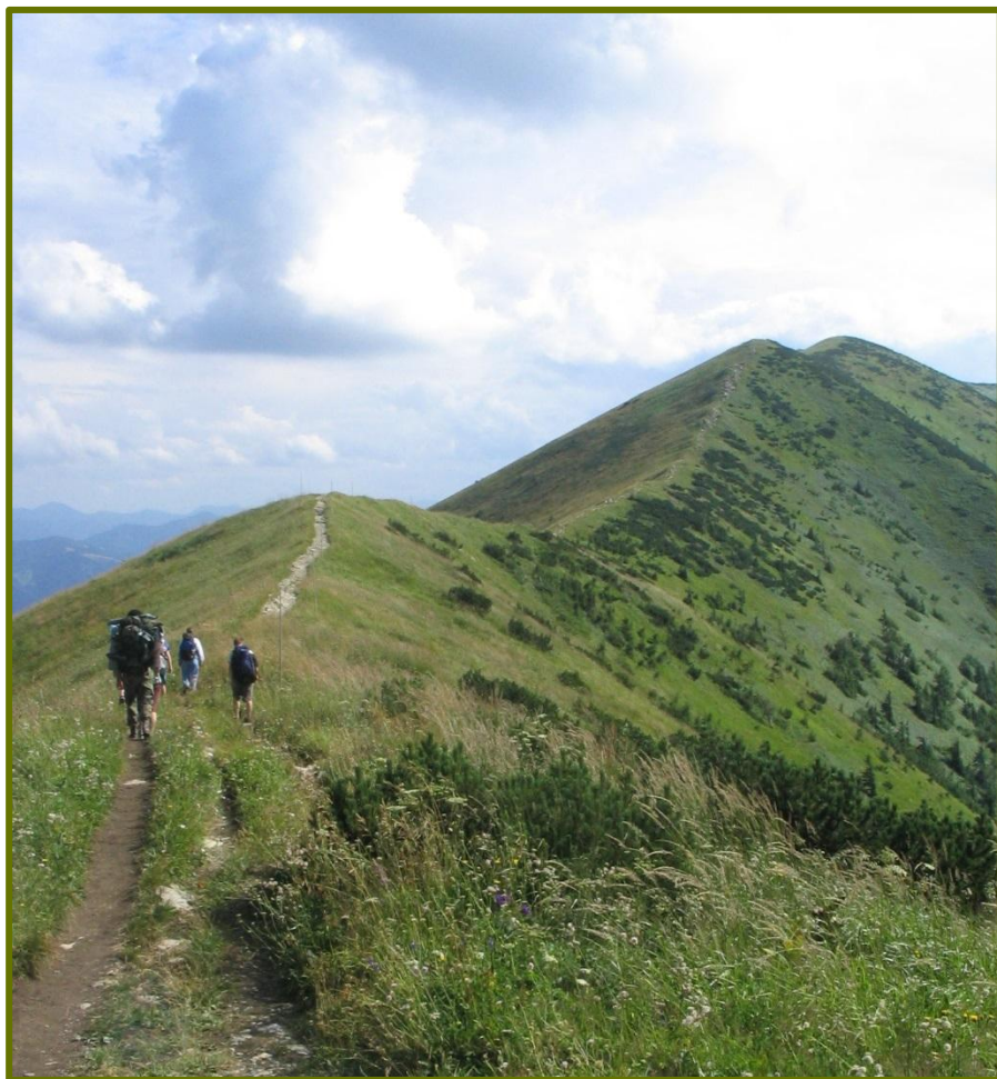
Roveři na Malé Fatře

děti, mládež a přitom naplnili tři skautské principy, hledáme nové formy činnosti. Pokud nám ubývá dětí, není to jen dobou, v níž žijeme, ale tím, že se nám je nedaří získat. A naopak nárůst členstva je dobrou vizitkou vedoucích. Práce vedoucích oddílů a činovníků střediska je náročná a zodpovědná a je asi nejcitlivějším místem v dalším rozvoji českého skautingu i našeho střediska. Všem činovníkům děkuji a přeji, aby se nám dařilo stejně nebo lépe než dosud a aby se stále objevovali noví nadšenci, kteří budou kráčet v našich šlépějích.