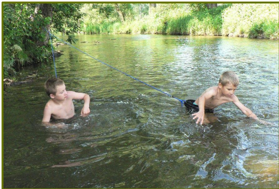
Letní tábor 33. smečky vlčat

Letní tábor 37. dívčího oddílu, 15. 7. – 29. 7. 2006, Vřesovice u Kyjova – po dlouhé době dívčí oddíl vyrazil na samostatný tábor. Uskutečnil se v Jihomoravském kraji na tábořišti ve Vřesovicích u Kyjova a hlavní náplní tábora byla celotáborová hra Holubinky. Sluníčko nám dopřávalo velké dávky záření, a tak jsme byly rádi, že jsme měli možnost využívat blízkou Osvětimanskou přehradu. Ke konci prvního týdne tábora vyšel v Jihomoravském kraji „zákaz rozdělování ohně“, což nás velice mrzelo, jelikož jsme přišli nejen o slibový oheň. Oželey jsme slibový oheň, který se uskutečnil v září. Situaci zachraňovaly petrolejky, které nám nahradily pagodu a vytvořily tzv. simulované ohniště.