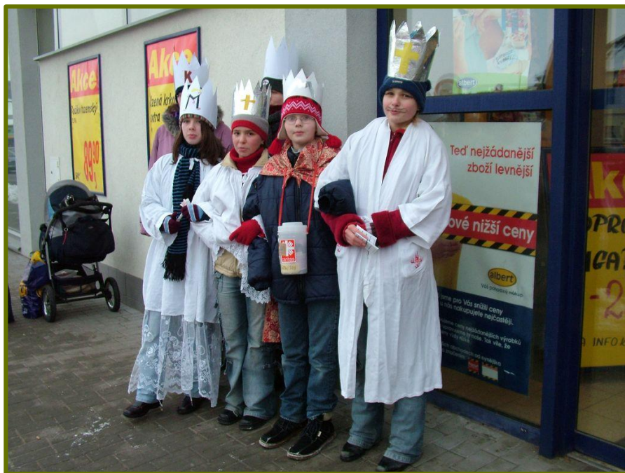
Skautky na Tříkrálové sbírce

Tříkrálová sbírka 2006 – ve čtvrtek 12. 1. 2006 vybírala družina světlušek Sněženek u Penny marketu i v pátek 13. 1. 2006 družina skautek Veverek u Alberta. V sobotu 14. 1. 2006 se zúčastnila většina členů střediska.