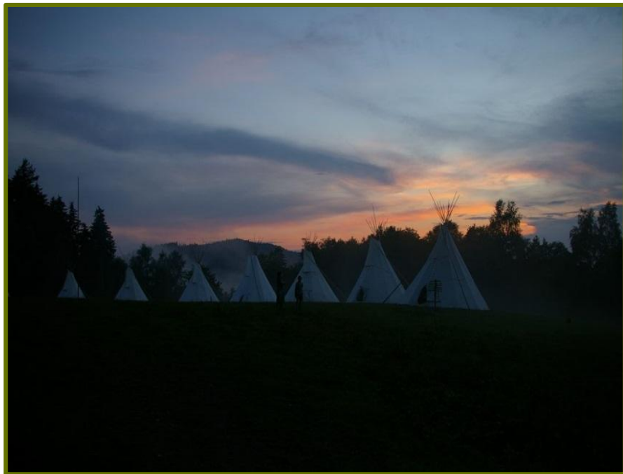
Tábor 33. smečky vlčat