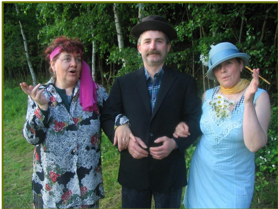
Oldskauti na srubu

místě za vítěznou šestkou Bobříků ze střediska Dolní Dobrouč, která postoupila do celostátního kola ZVaS v Letohradě.