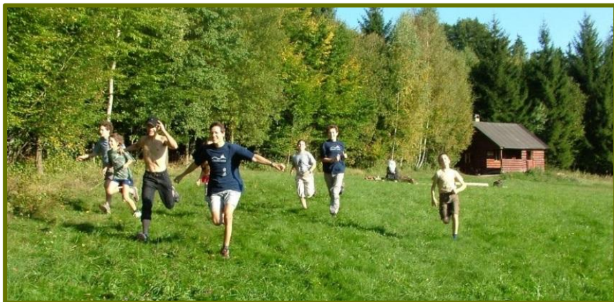
Výprava na Kopretinovou louku