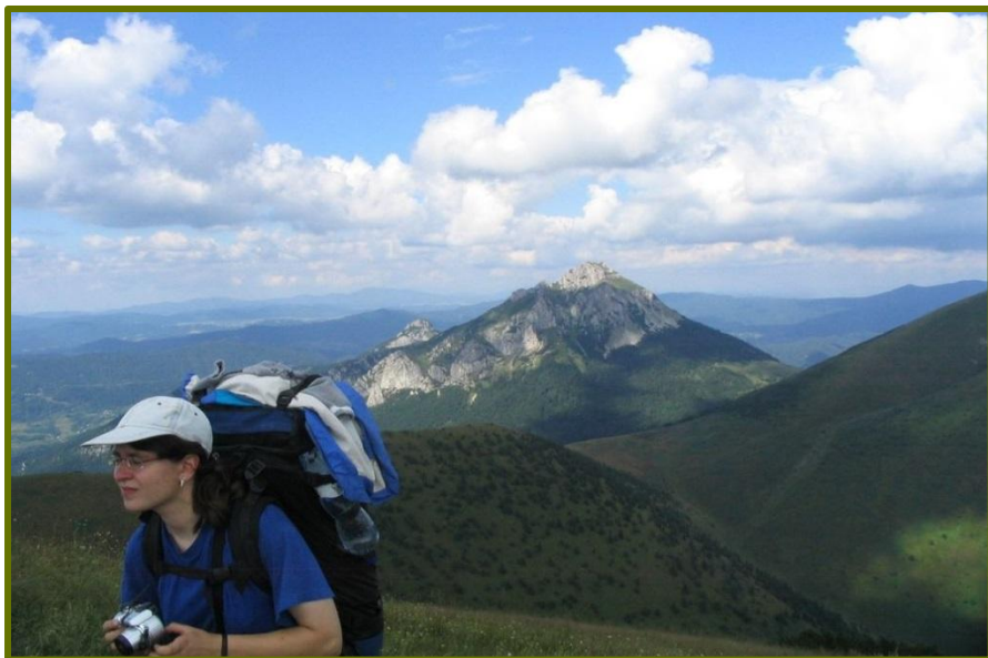
Puťák na Malou Fatru